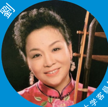
東京音楽大学客員教授