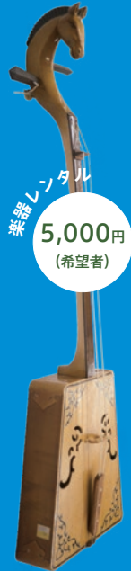
楽器レンタル 5,000円 (希望者)

馬頭琴奏者・東京富士大学准教授。内モンゴル生まれ。2000年来日。現在は演奏活動に加え、TV番組、映画、アニメ、ゲーム、舞台音楽のテーマ曲などの演奏、作曲を手掛ける。代表的な演奏作品は日本/モンゴル合作映画「蒼き狼地果て海尽きるまで」において、馬頭琴演奏で劇中曲を担当、NHK『ほっと・アジア』エンディングテーマ、フジテレビ『踊る大捜査線 THE LAST TV』に出演、TVアニメ『アングロモア元寇合戦記』の劇伴にて演奏。2020年全国小学校向け国語のデジタル教科書にて馬頭琴を演奏。2022年監督として映画「草加煎餅物語」制作。