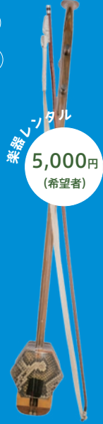
楽器レンタル 5,000円 (希望者)

国立中国音楽学院及び中央音楽学院卒業。東京音楽大学客員教授、中国音楽学院客席教授・首都師範大学客席教授・二胡検定公認審査員。2000年9月上海市人民政府より「荣誉证书」を受ける。中国電影樂團民族オーケストラのコンサート・ミストレス兼ソリストを長く務め、「少林寺」「西遊記」ほか100本以上の映画音楽の制作、演奏に参加した。1987年来日。東京藝術大学を経て、東京音楽大学で作曲家、伊福部昭氏に師事。