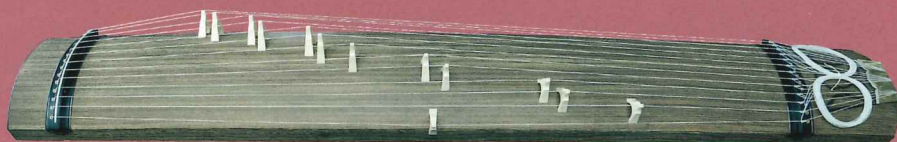
楽器について：講座では大学所有の楽器を使用します。

初級 全くの初心者、又は以前に学習経験のある方を対象とするアンサンブル講座です。楽しく合奏することを主旨としながら、技術を高めます。合奏を楽しみたい方も技術の向上を追求する方も満足いただけるよう、個々のレベルに対応した指導を致します。良い音を奏でる為の基本的な姿勢、注意点も交えながら講座を進めます。独奏には無い、合奏ならではの楽しさを味わいながら学習します。課題曲は事前に受講希望者と相談の上決定致します。